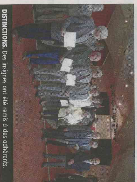
DISTINCTIONS. Des insignes ont été remis à des adhérents.

« Les actifs d'aujourd'hui seront les retraités de demain. Notre association vieillit, il nous faut de nouveaux adhérents pour