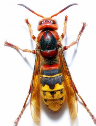
Frelon commun (jusqu'à 4 cm)