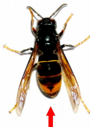
Frelon asiatique (taille réelle 3 cm)

Pour tuer le frelon s'il n'est pas mort : congélation pendant 2 heures pour l'anesthésier puis écraser ou découper l'insecte pour être sûr qu'il ne reparte pas.